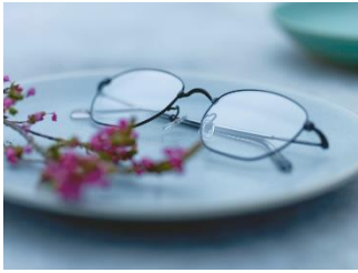
PARIS MIKI — Authentic Eyewear —