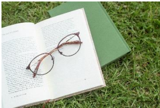
style J made in Japan eyewear