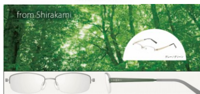
北海道・東北エリア限定 世界遺産の白神山地をイメージした深いグリーン