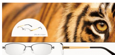
関西限定 闘う猛虎をイメージしたイエロー