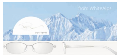
中部・北陸エリア限定 日本列島の中央を縦走する白銀の頂、 日本アルプスをイメージしたホワイト