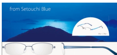
中国・四国限定 蒼く輝く瀬戸内、海をイメージしたブルー