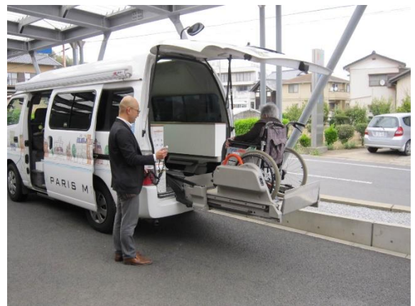
茨城で活動する車両はリフト機を搭載