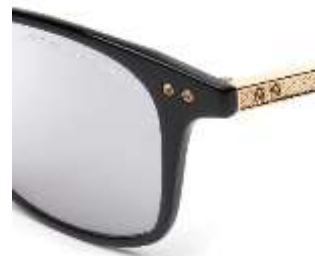
ディテール (ななめ拡大)