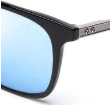
ディテール（ななめ拡大3）