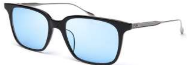
DITA DRX-2074 BIRCH LIMITED