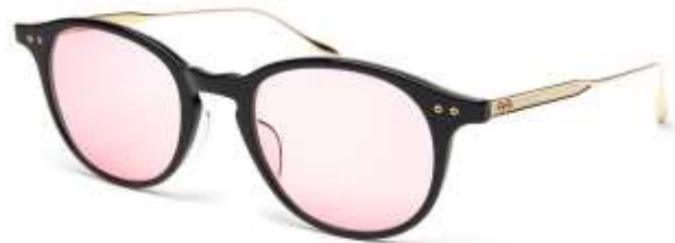
DITA DRX-2073 ASH LIMITED