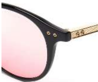
ディテール (ななめ拡大2)