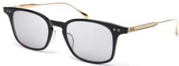
DITA DRX-2072 BUCKEYE LIMITED